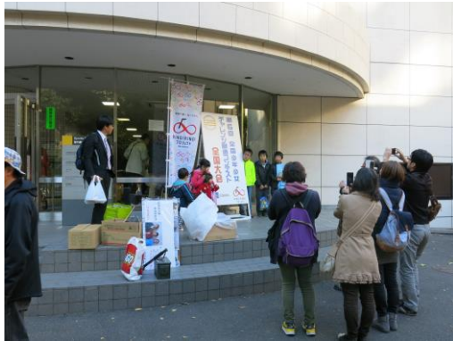
全国大会会場入口（東京工業大学）