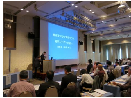
少年少女発明クラブ全国会議