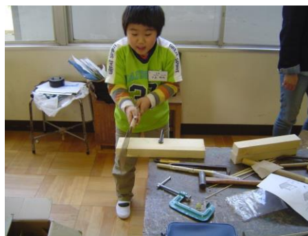
少年少女発明クラブの活動