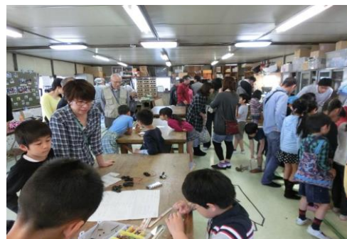
公開発明教室の開催