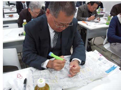
九州ブロック合同研修会（実技研修）