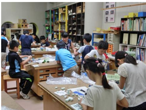
地区大会（創作指導会）

6月から9月の期間に全国82地区において地区大会が開催された。総勢660チームの青少年が地域を紹介する「からくりパフォーマンスカー」を作成し競技に臨んだ。