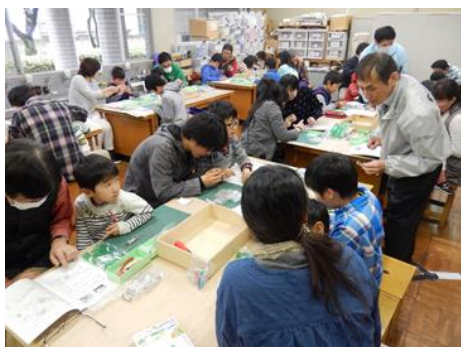
公開発明教室の開催