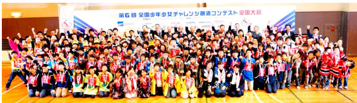
出場全チームの記念撮影