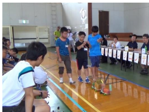
地区大会（コンテスト競技会）