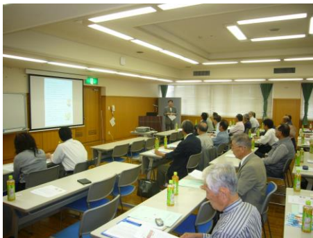
中国ブロック合同研修会