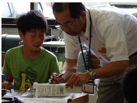
少年少女発明クラブの活動