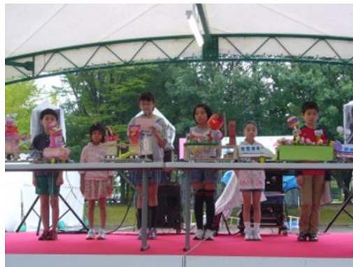
となみ産業フェア会場での発表会